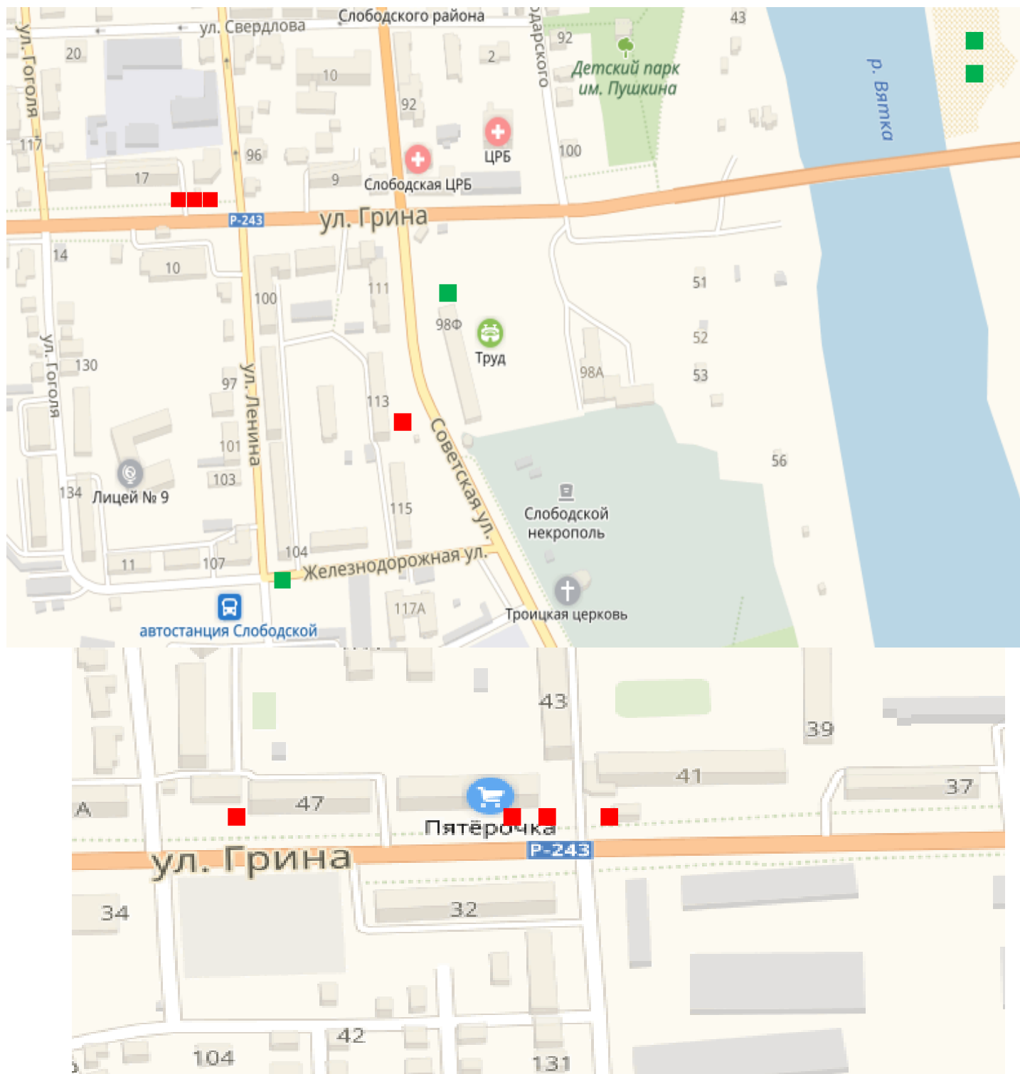
Схема размещения нестационарных торговых объектов на территории муниципального образования «город Слободской» (лист 3)