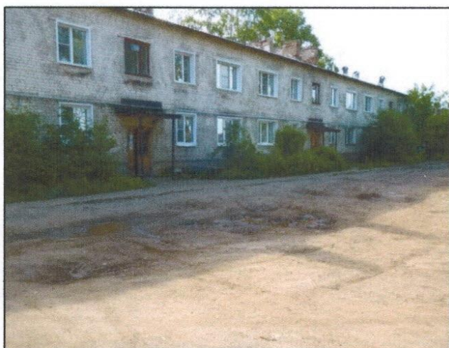
Существующее состояние проезда