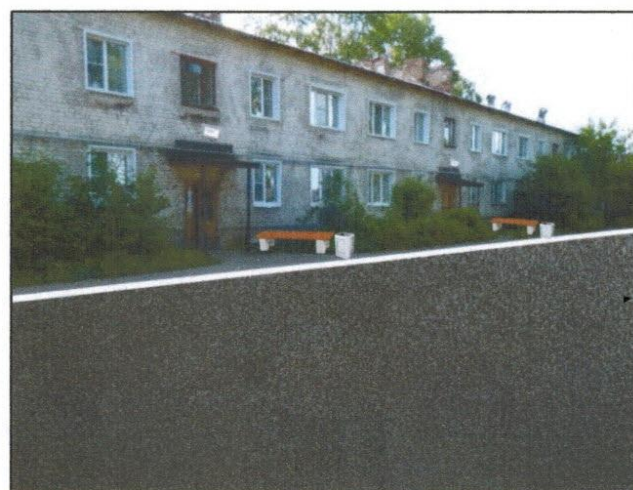
Планируемое состояние проезда